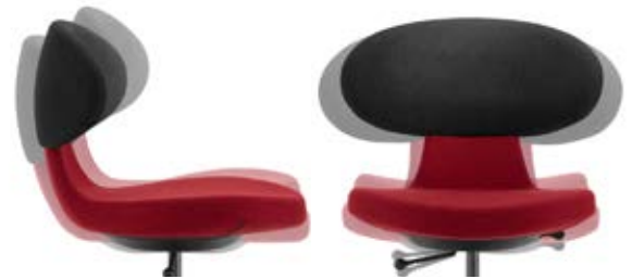
_1 3D Bewegungsmechanik Mécanisme de mobilité 3D