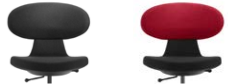
_1 einfarbig unicolore